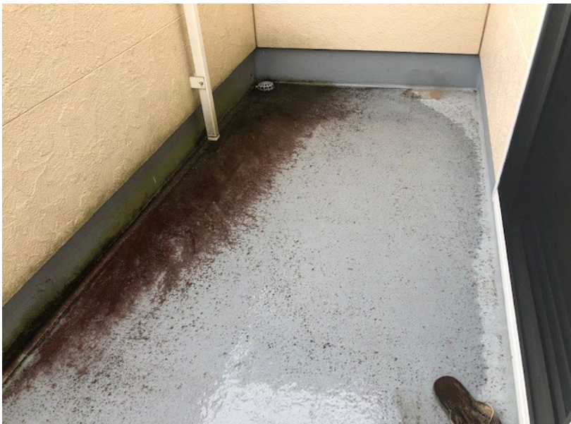
No. 8 バルコニー床