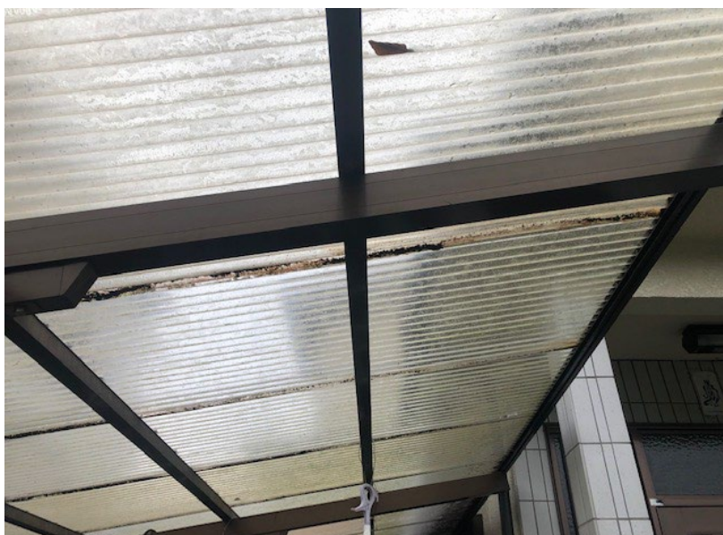
No. 9 カーポート