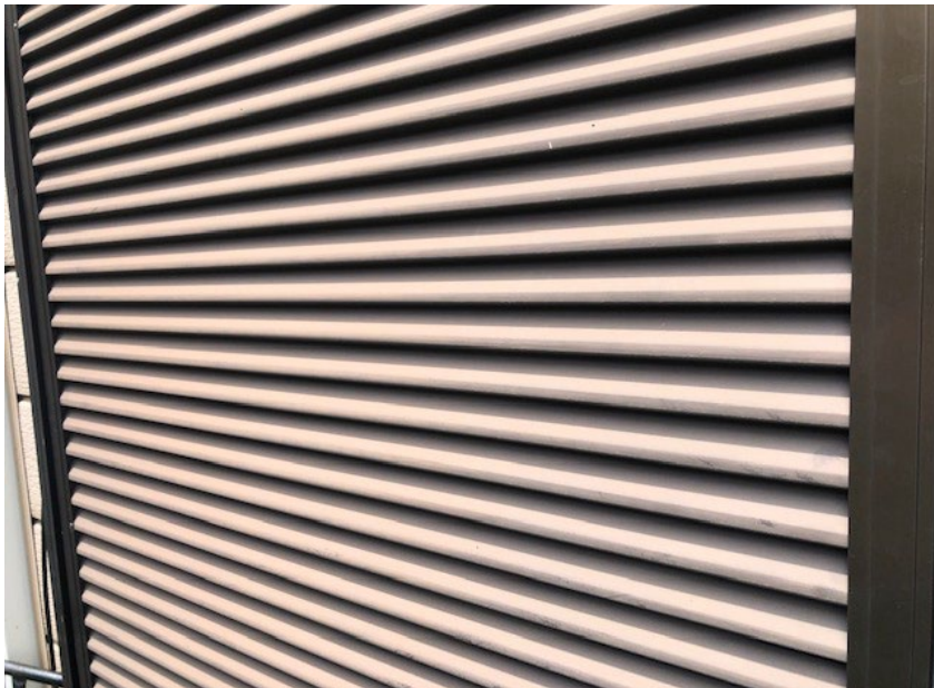
No. 7 雨戸